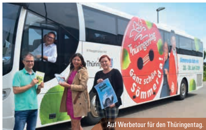
Auf Werbetour für den Thüringentag.

Shuttlebusse fahren alle 20 bzw. 30 Minuten.